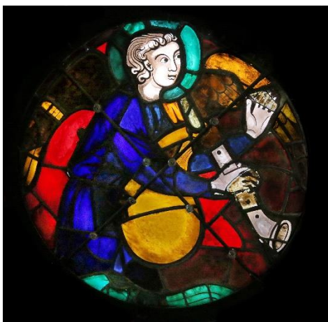
Ange musicien de la grande Rose, joueur de cornemuse

Il s'agit ici d'un aperçu des différents instruments dans le programme iconographique de la cathédrale. D'autres corpus existent, comme les rois musiciens de l'arbre de Jessé, les vertus cardinales ou les tons de la musique. Toutes ces représentations servent le même message : la glorification de la grande Église et le rôle prédominant de la cathédrale de Reims, cathédrale des sacres et Jérusalem céleste, dans le monde chrétien du XIII e siècle.