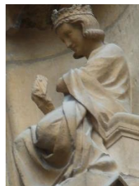
Roi joueur de harpe

Sur ces quatre rois, trois jouent d'un instrument de musique : une harpe, un psaltérion et une vièle à archet. L'intérêt de ces trois instruments est multiple :