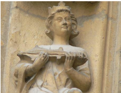
Roi de l'arbre de Jessé, joueur de citole