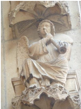
Ange sonnant de la trompe, portail du Jugement dernier

Malgré leurs représentations multiples dans les décors de nos églises, les instruments de musique n'étaient pas les bienvenus au sein des cathédrales du Moyen-âge. La musique des offices était uniquement composée de chant en monodie, puis à partir des XIII e et XIV e siècles, en polyphonie. L'orgue, seul instrument toléré au cours des offices, était utilisé comme guide-voix. Cependant, on donnait aux instruments de musique un sens qui justifiait leur présence dans les décors des portails et des vitraux.