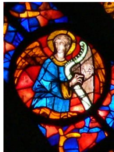
Ange musicien de la grande Rose, joueur de harpe