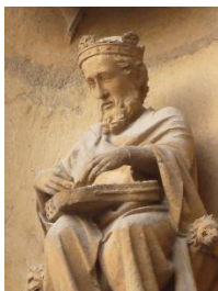
Roi joueur de psaltérion

entre en écho avec d'autres éléments du décor, comme la galerie des rois de la façade occidentale.