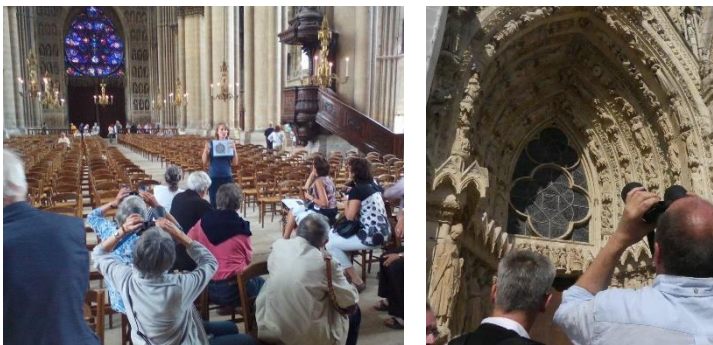
Visites guidées à la cathédrale de Reims

Depuis 2016, l'association Instrumentarium de Reims œuvre sur plusieurs points afin de présenter l'ensemble des instruments de musique à un public varié. Des visites guidées sont proposées pendant les vacances. Ces visites guidées, gratuites, sont menées à deux voix par une guide-conférencière et par un luthier. Nous tenons à ce double discours qui insiste sur l'organologie et l'histoire de l'art et qui se complète l'un et l'autre. De même, nous échangeons lors de ces visites avec le public, toujours avide de connaissance et riche de bonnes idées.