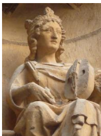
Roi joueur de vièle