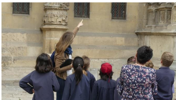
Visite guidée de la cathédrale de Reims avec des scolaires

D'autres projets de médiation sont en cours de réflexion : création d'une exposition itinérante, mise en place de concerts pédagogiques, de journées d'études, ou encore publications d'articles dans divers journaux spécialisés. De nombreux projets qui nous permettront d'avancer davantage dans l'objectif principal de l'association : la restitution des instruments de musique de l'instrumentarium de Reims.