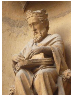
Roi musicien, joueur de psaltérion, arbre de Jessé du portail central

Au Moyen-âge, les instruments de musique sont divisés en deux catégories : instruments hauts et bas. Les trompes ou les cors étaient des instruments hauts, c'est-à-dire utilisés comme signal et marqueur social lors de tournois, lors de la chasse ou dans des banquets. Ces instruments donnaient un son puissant