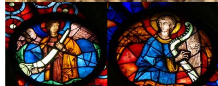
Vitrail : Grande rose - façade occidentale