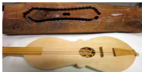
Premier prototype d'une vièle à archet