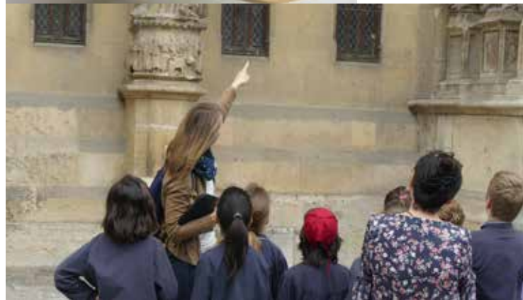
Visite guidée auprès d'un groupe scolaire